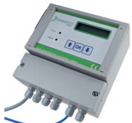
Darstellung zeigt Sonderausführung. Illustration depends on product variant.

Steuerung für Kleinkläranlagen mit Wirbelschwebbettverfahren Control unit for small RBBR-wwt-plants