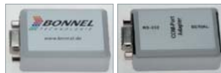
AC-SW8 Typ / type