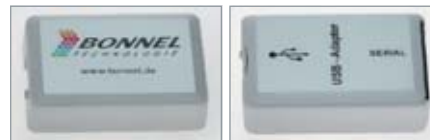
AC-UW8 und / and AC-UA5 Typ / type